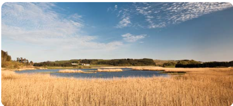
Grudavatn i Klepp er det første våtmarksreservatet i Rogaland, opprettet i 1974

Langs Figgjovassdraget er det mange rike våtmarksområder, bl.a. Grudavatnet. Vatnet er grunt, næringsrikt og et av Jærens mest artsrike. Her lever et mangfold av insekter, planter og dyr. Det vandrer laks, sjørørret og ål gjennom vatnet.