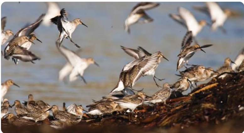
Vadefugler på trekk finner mat og hvile i tarevollene på Jærkysten

Jæren våtmarkssystem er en samlebetegnelse for de 23 vernet Ramsar-områdene på Jæren, og består av ni innsjøer, tre myrer, ni gruntvannsområder og skjærgårdsområder (se kartet). Våtmarkene er svært viktige for fugler på vei til eller fra overvintringsområder i Europa og i Afrika. I verneområdene finner fuglene mat og hvile før ferden fortsetter sørover. Det milde klimaet på Jæren frister også ender, dykkere, gjess, svaner og vadefugler til å overvintre i de grunne og næringsrike innsjøene og i de frodige marine gruntvannsområdene. I verneområdene er det ikke tillatt med tiltak som kan redusere eller ødelegge områdenes verdi for fugle-, dyre- og plantelivet.