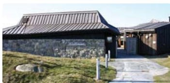
Friluftshuset Orre, Klepp