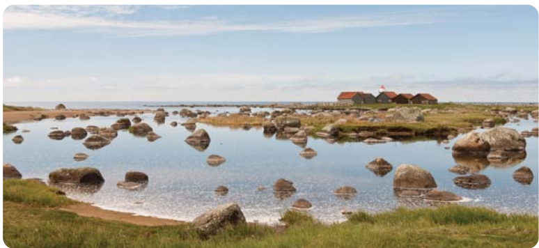
Ved elvemunningen i Håelva

Før Håelva renner ut i Jærhavet, flyter den over en flat slette. Ved høyvann går sjøen inn i elvemunningen og frakter med seg næringsstoffer. Det fører til stor produksjon av planter og dyr som er mat for fugler. De fleste elvemunninger i Rogaland er påvirket av inngrep/utbygging.