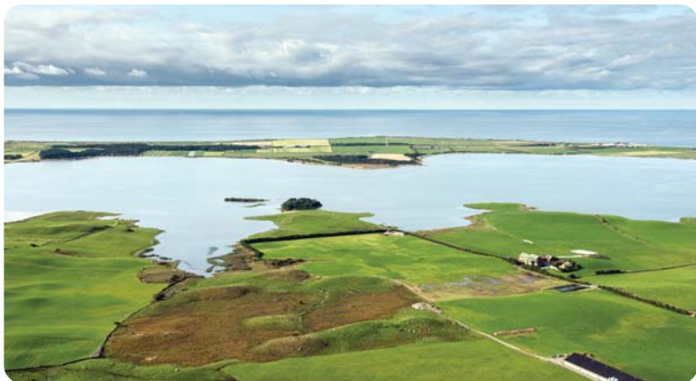
Orrevatn I Klepp – ett av 23 Ramsar-områder på Jæren