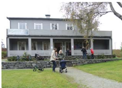
Mostun natursenter, Stavanger

Kontaktadresse JVS: Tlf. 51 52 88 11 / 977 12 253 / e-post: post@mostun.no