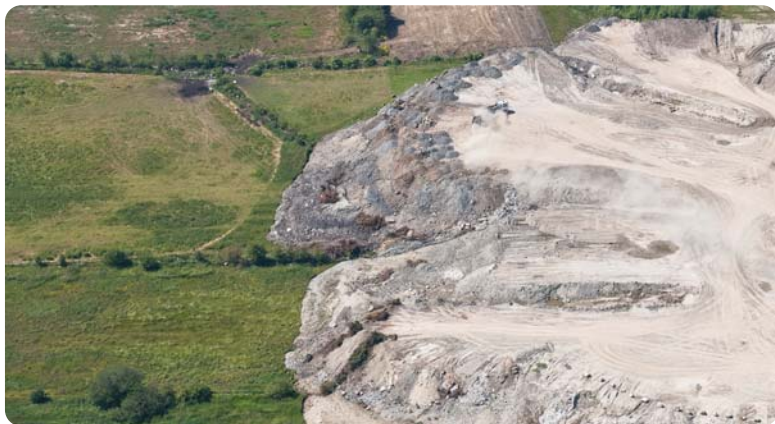
Utfylling av våtmarksområdene på Jæren

Forsviner våtmarkene, mister vi også plantene og dyra som bare lever i disse områdene. Dessuten er våtmarkene viktige som vannkilder. Omlag halvparten av verdens våtmarker er helt eller delvis ødelagt siden den industrielle revolusjonen startet rundt 1850. Det gjelder også i Norge, og særlig på Jæren. Byvekst og effektivisering av jordbruket har gjort at våtmarkene nå er en utryddingsstruet naturtype.