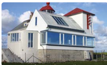
Friluftsfyret Kvasheim, Hå